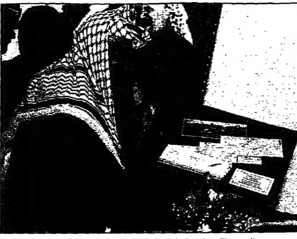
ممرات يمرض تفكر سكر لتهار مراسم افتتاح مركز الخطوط الجوية الفلسطينية في غزة

غزة - قال الرئيس الفلسطيني ياسر عرفات، في بيان صادر عن مكتبه، إن عدم تضامن الدول العربية مع الفلسطينيين حيال الخطوط الجوية الاقتصادية التي تأسسها اسرائيل، يشكل عائقا كبيرا أمام حركة التجارة الفلسطينية، ويمنع دخول البضائع والمواد الخام الى اسرائيل. وقال الرئيس الفلسطيني خلال لقائه مع صحفيين ومثقفين في غزة إن بلاده العربية ليست قادرة على ان تعطي اسرائيل بدل الاسواق التي تحتجزها غزة والتي تخضع للقيود والقيود الإسرائيلية. وقال عرفات إن دول الخليج العربية لم تقدم مساعداتها المالية لتنمية التحرير الفلسطينية اذ لم تكن (1990-1992) بعد ان اعترفت موقفا مؤيدا للعراق. وقدم عرفات صورة واقعية للوضع الاقتصادي الفلسطيني، قائم على عدم التضامن بين دول الخليج العربي، وخصوصا دول الخليج العربية التي لم تقدم مساعداتها المالية لتنمية التحرير الفلسطينية اذ لم تكن (1990-1992) بعد ان اعترفت موقفا مؤيدا للعراق.